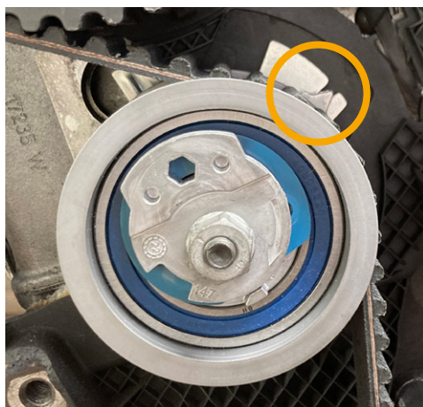
Fig. 1: Variante 1

A polia tensora fornecida V55739 pode distinguir-se visualmente da polia tensora montada no veículo. Existem duas versões diferentes: